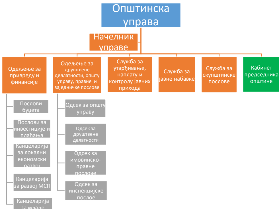
Дијаграм 2: Организациона структура Општинске управе општине Ражањ

У оквиру основних јединица - одељења, образоване су уже организационе јединице – Одсеци.