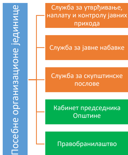
Дијаграм 3: Посебне организационе јединице

У оквиру Одељења за друштвене делатности, општу управу, правне и заједничке послове образују се матична подручја за извршење одређених послова из надлежности Општине, као и поверених послова државне управе. Следећа матична подручја су формирана: