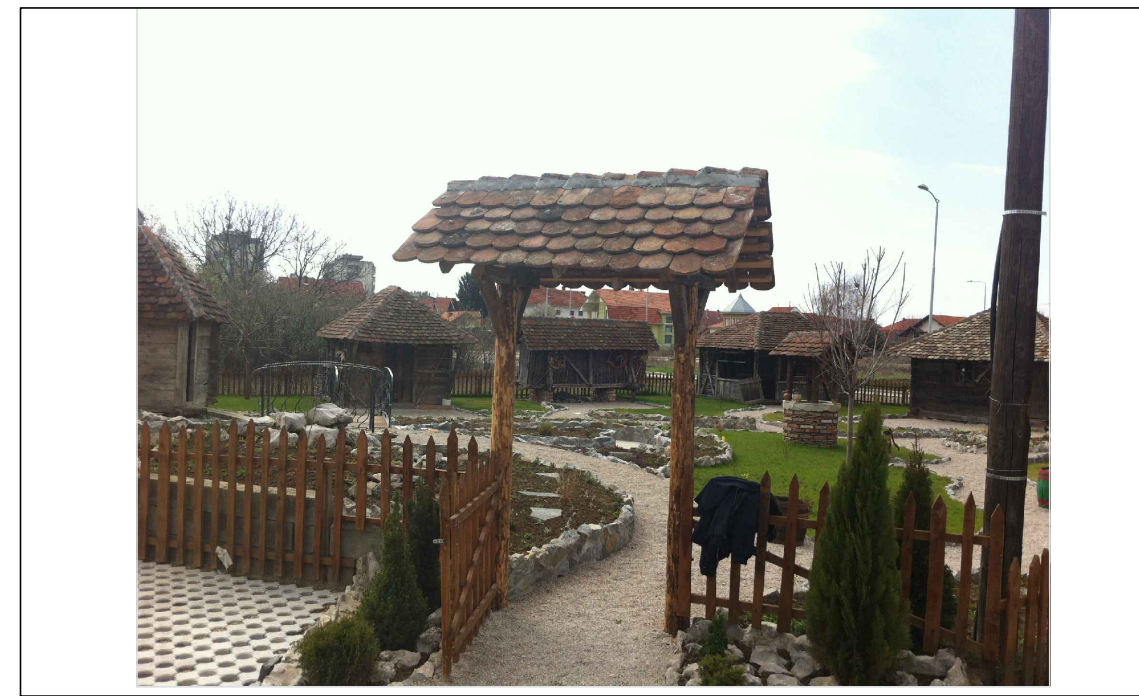
СПОРЕДНИ УЛАЗ У КОМПЛЕКС